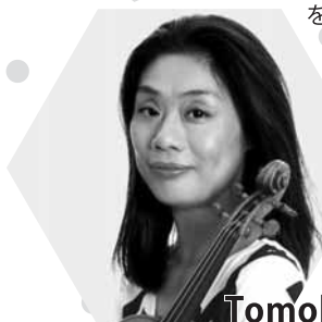
Tomoko Kato, Violin

ジュリアード音楽院に留学後、1982年の第7回チャイコフスキー国際コンクールで第2位。リサイタル、協奏曲、室内楽に活躍するトップ・アーティストの一人。ストラディヴァリウスを手に、美しい音色と深く丁寧な音楽作りで一段と魅力を増している。録音も活発で、CDは「オペラ座の夜」、「エルガー／愛のよここび」のほか、2009年には名手・江口玲をピアニストに迎え「シューマン:ヴァイオリン・ソナタ集」をリリース。現在は桐朋学園教授も勤める。