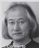
矢崎彦太郎 (指揮) Hikotaro Yazaki Conductor