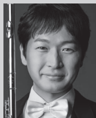
神田勇哉 (フルート) Yuya Kanda Flute