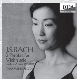
J.S.バッハ 無伴奏ヴァイオリン・ パルティータ全曲、他