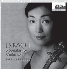
J.S.バッハ 無伴奏ヴァイオリン・ソナタ全曲

Octavia Records Inc. WEB SHOP: https://octavia-shop.com/