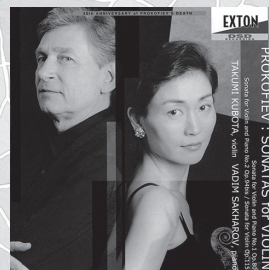
プロコフィエフ: ヴァイオリン・ソナタ全曲

ピアノ: ヴァディム・サハロフ [CD] OVCL-00099 ¥2,857(税別)