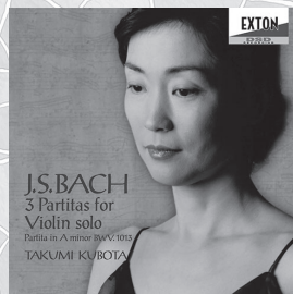
J.S.バッハ 無伴奏ヴァイオリン・ パルティータ全曲、他