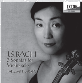
J.S.バッハ 無伴奏ヴァイオリン・ソナタ全曲

Octavia Records Inc. WEB SHOP: https://octavia-shop.com/